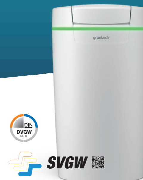
Impianto di addolcimento softliQ:MD

I nuovi impianti softliQ non offrono solo un nuovo mondo di acqua dolce. softliQ:SD23 anche un mondo di nuovi servizi. Il nostro modello per piccole applicazioni di addolcimento include il pacchetto completo dei servizi. Un set di isolamento e un raccordo fognario sono inclusi nella fornitura di questo modello. Interagisce direttamente con voi e con gli altri dispositivi Grünbeck tramite le nuove interfacce di comunicazione. Assicura una fornitura di acqua dolce per un massimo di 12 persone.