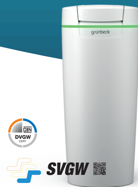
Impianto di addolcimento softliQ:SD

Con i nuovi impianti softliQ è possibile sfruttare un'intera gamma di servizi. Tutte le misure sono dotate del nuovo display touch. Ciò garantisce un utilizzo comodo e intuitivo. L'impianto pensa in anticipo per voi: tramite la fotocellula a infrarossi softliQ misura il livello di riempimento del sale e vi ricorda tempestivamente quando è necessario ricaricare. Tramite display, tramite l'app Grünbeck myProduct e, se si desidera, tramite e-mail, rimarrete informati in qualsiasi momento. Il sensore acqua integrato, che monitora eventuali perdite d'acqua incontrollate nel luogo di installazione del dispositivo, offre un'ulteriore sicurezza per la vostra casa.